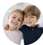
Für den Nachwuchs

Gesundheitslösungen für Männer: Immunglobulin A (IgA), Cortisol, DHEA, Testosteron. Zusätzliche Parameter je nach Beschwerden und Altersgruppe